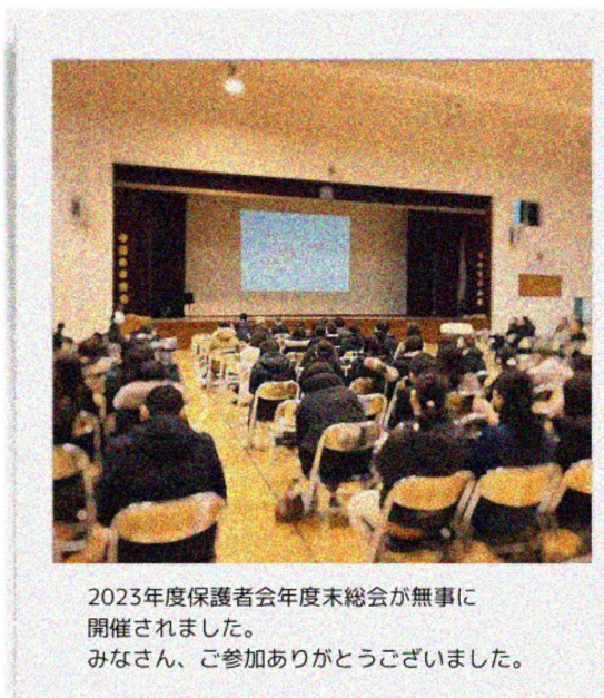
2023年度保護者会年度末総会が無事に開催されました。 みなさん、ご参加ありがとうございました。